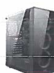
Turbo-X Erebus E220S Desktop (Intel Core i3 9100F/8 GB/240 GB SSD/1)