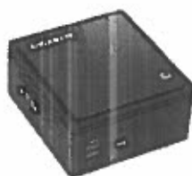
Turbo-X MiniCube J3160 X2 Desktop (Intel Celeron J3160/4 GB/60 GB//Intel