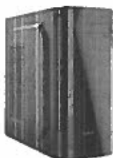
Turbo-X Sphere SK65 (AMD Ryzen 3 3200G/4 GB/240 GB SSD//Radeon