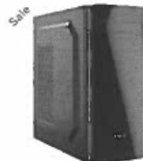
Turbo-X Sphere SK90 Desktop (Intel Core i3 9100F/4 GB/240 GB