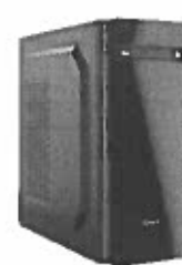
Turbo-X Sphere SK450F Desktop (Intel Core i5 9400F/8 GB/240 GB