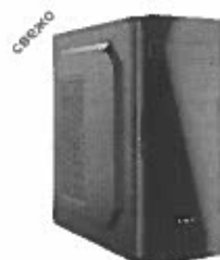
Turbo-X Sphere SK100 Desktop (Intel Core i3 10100/4 GB/240 GB/HD