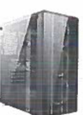
Turbo-X Erebus E355 Desktop (AMD Ryzen 5 3400G/8 GB/240 GB)