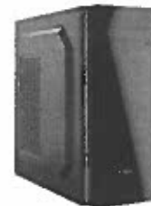
Turbo-X Sphere SK335 (AMD Ryzen 5 3400G/8 GB/240 GB SSD//Radeon