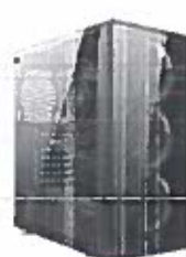
Turbo-X Erebus E135 Desktop (AMD Ryzen 3 3200G/8 GB/1 TB)