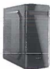
Turbo-X Sphere SK500 Desktop (Intel Core i5 10400/8 GB/240 GB/HD)