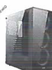
Turbo-X Erebus E500 Desktop (Intel Core i5 10400/8 GB/240 GB/GTX)