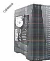
Turbo-X Nemesis N115T Desktop (AMD Ryzen 5 3600XT/8 GB/250 GB/RX)