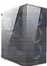
Turbo-X Erebus E230S Desktop (Intel Core i3 10100/8 GB/240 GB/GTX)